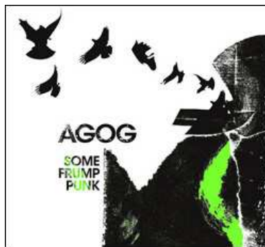
AGOG Some Frump Punk TryTone