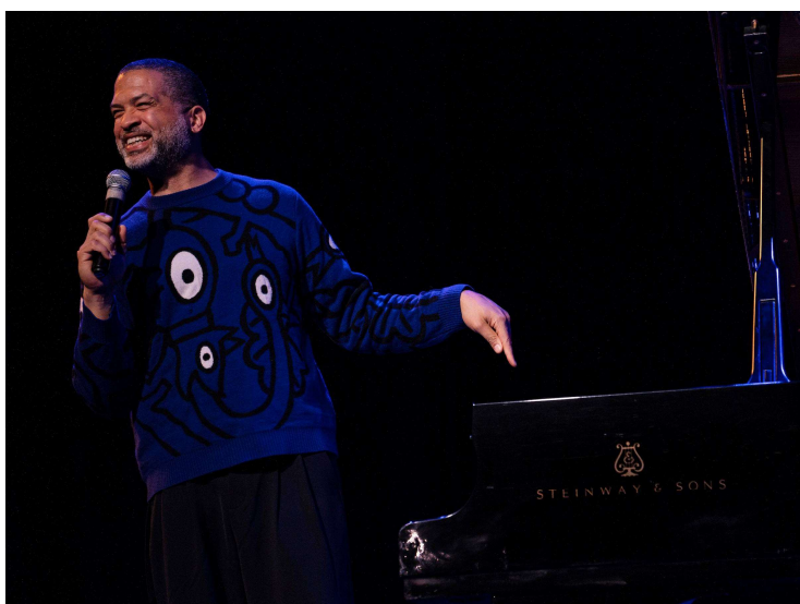
Jason Moran.

Cecile McLorin Salvant en haar kwartet speelden zonder setlist. Met suggesties uit het publiek ontstond een show waar het plezier vanaf spatte en die onweerstaanbaar was.