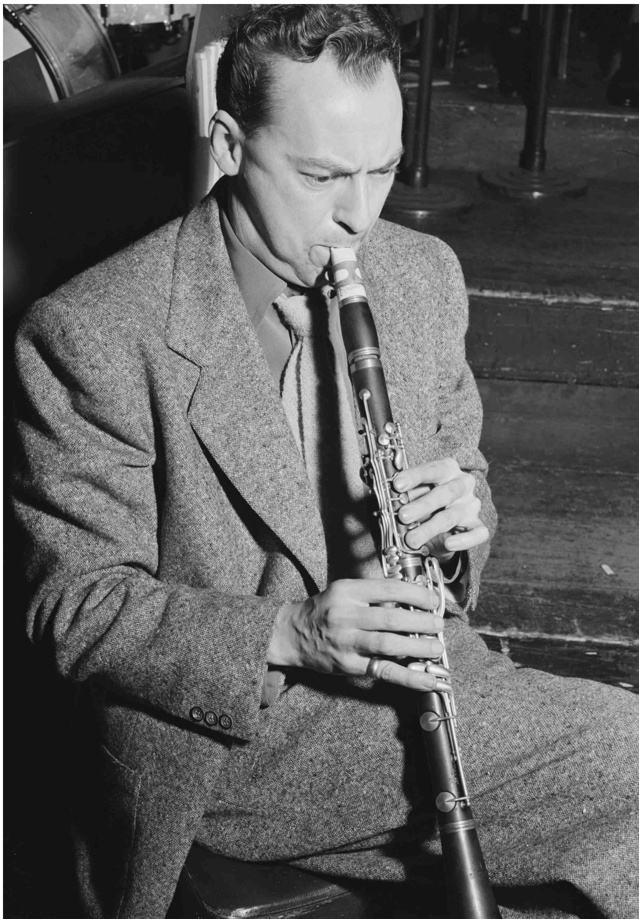
Woody Herman, New York, april 1946.