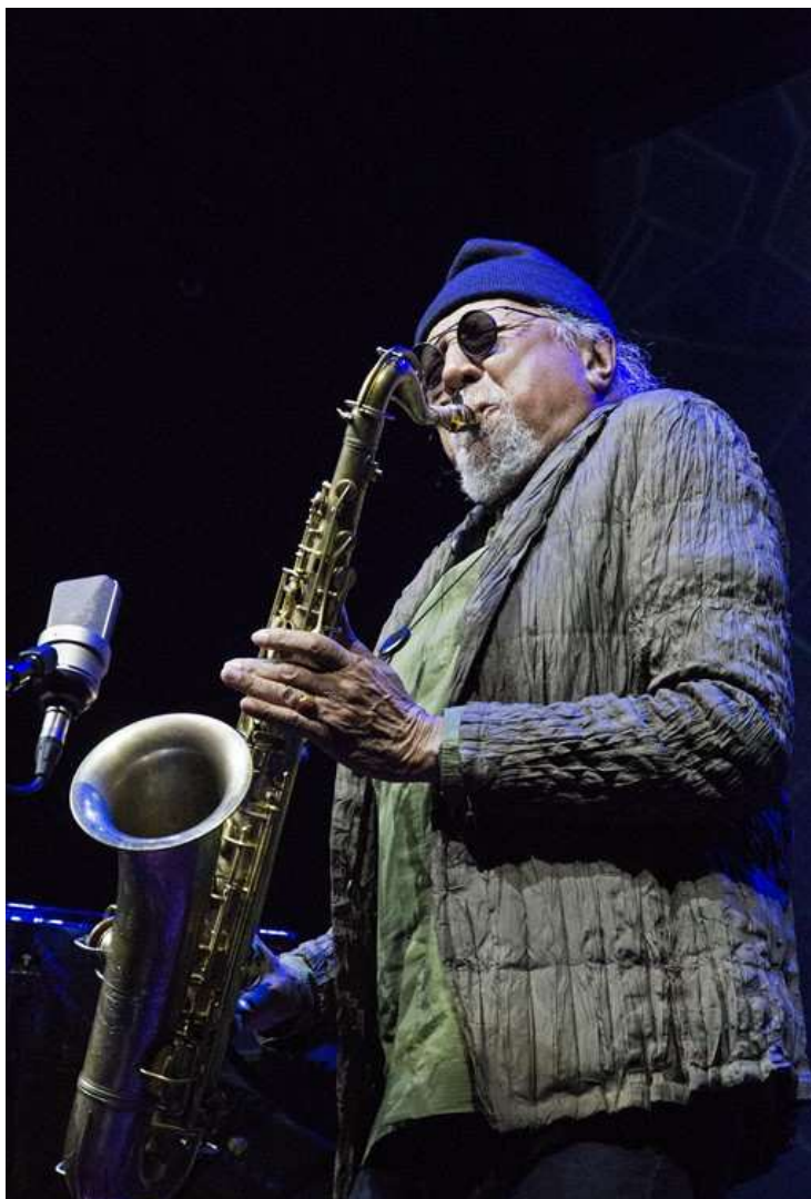
Charles Lloyd.

Grammy Awards worden sinds 1959 jaarlijks uitgereikt door de Recording Academy of the United States. Platen die in het afgelopen jaar zijn uitgekomen dingen mee naar de onderscheiding.