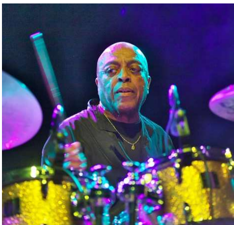
Roy Haynes.