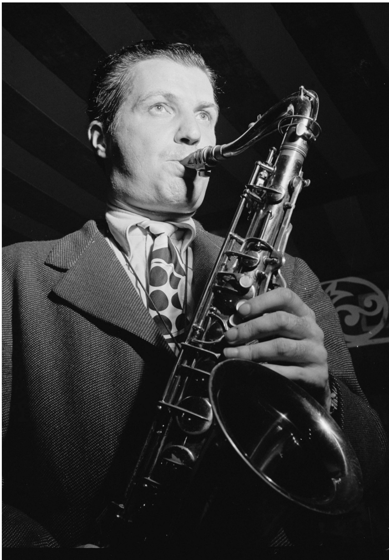
Charlie Barnet, Aquarium, New York, augustus 1946.