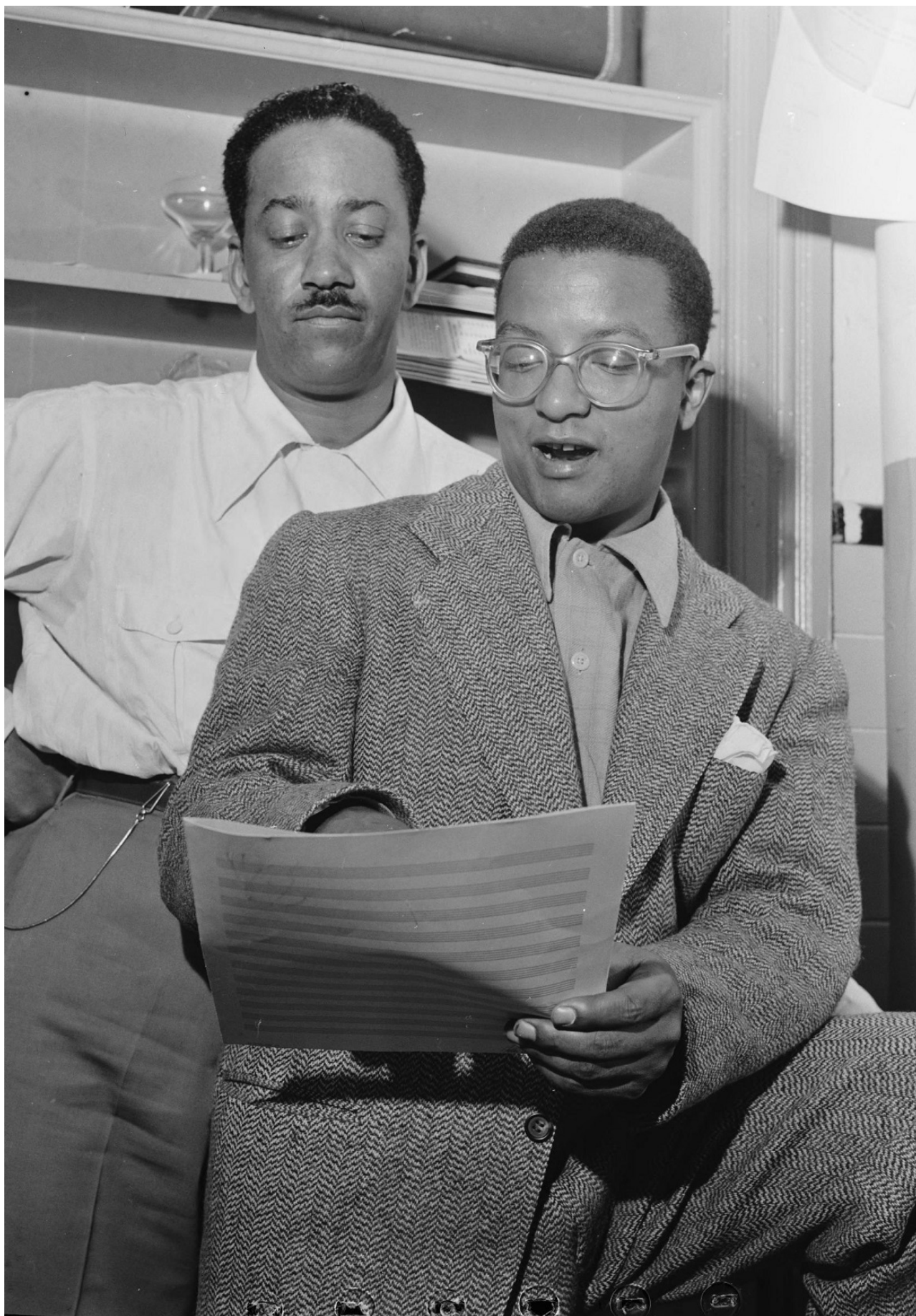
Billy Strayhorn (rechts), New York, juni 1947.