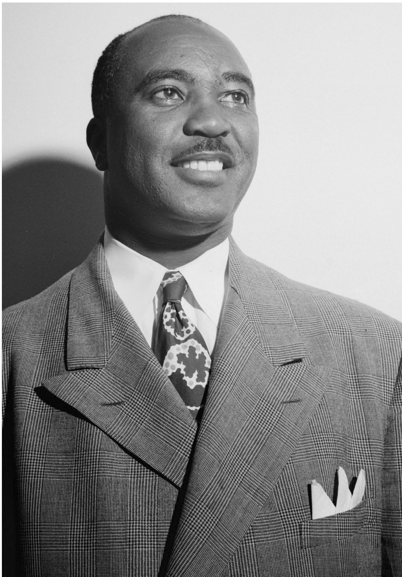
Jimmie Lunceford, New York, augustus 1946.