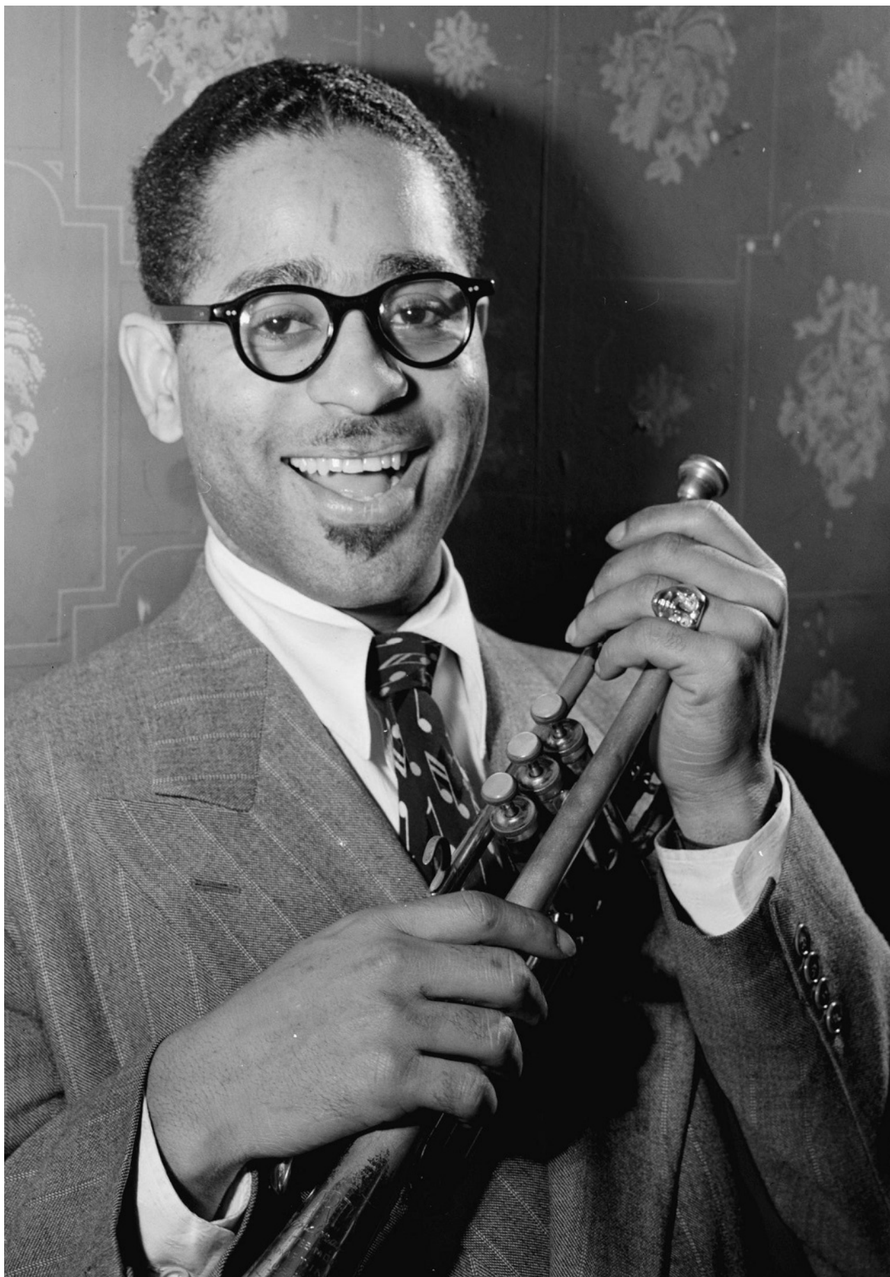
Dizzy Gillespie, Famous Door, New York, juni 1946.