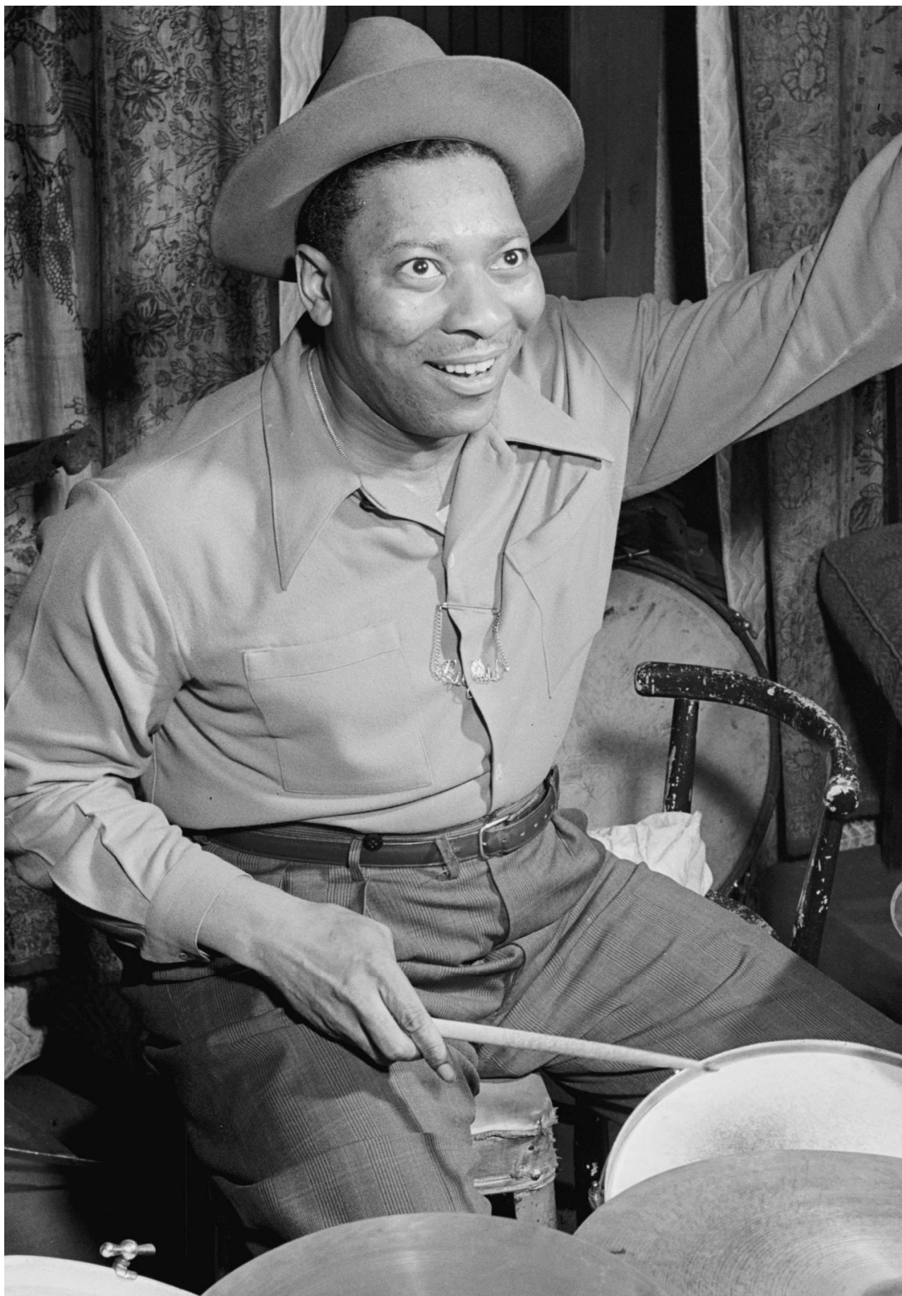
Sid Catlett, New York, maart 1947.