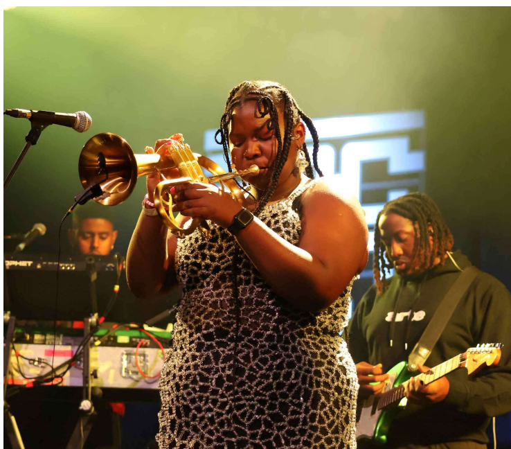
Kokoroko bood een vrolijke noot.