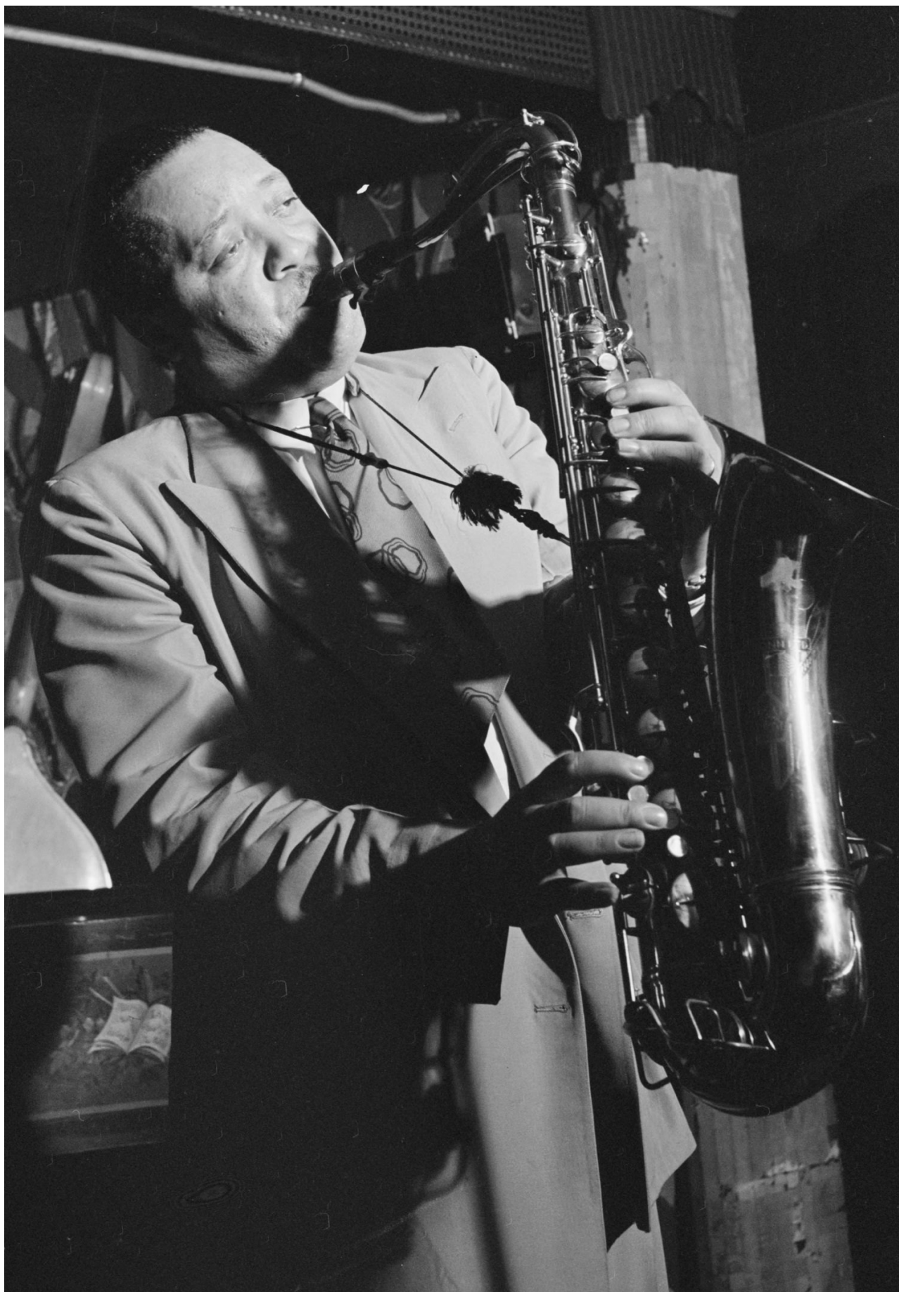
Lester Young, Famous Door, New York, september 1946.