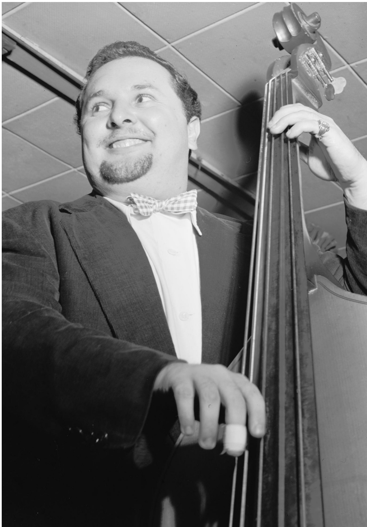
Chubby Jackson, Onyx, New York, juli 1947.