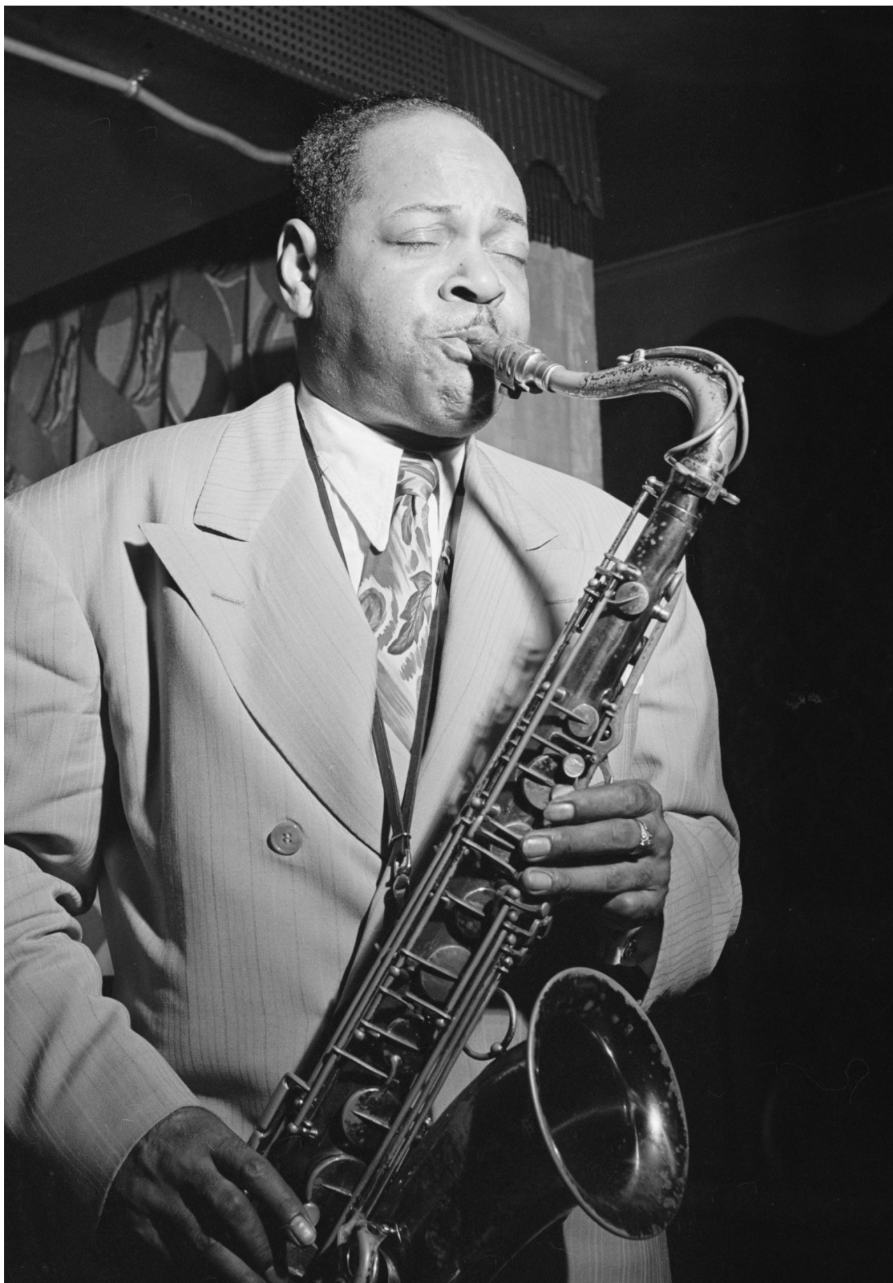
Coleman Hawkins, Spotlite (Club), New York, September 1946.