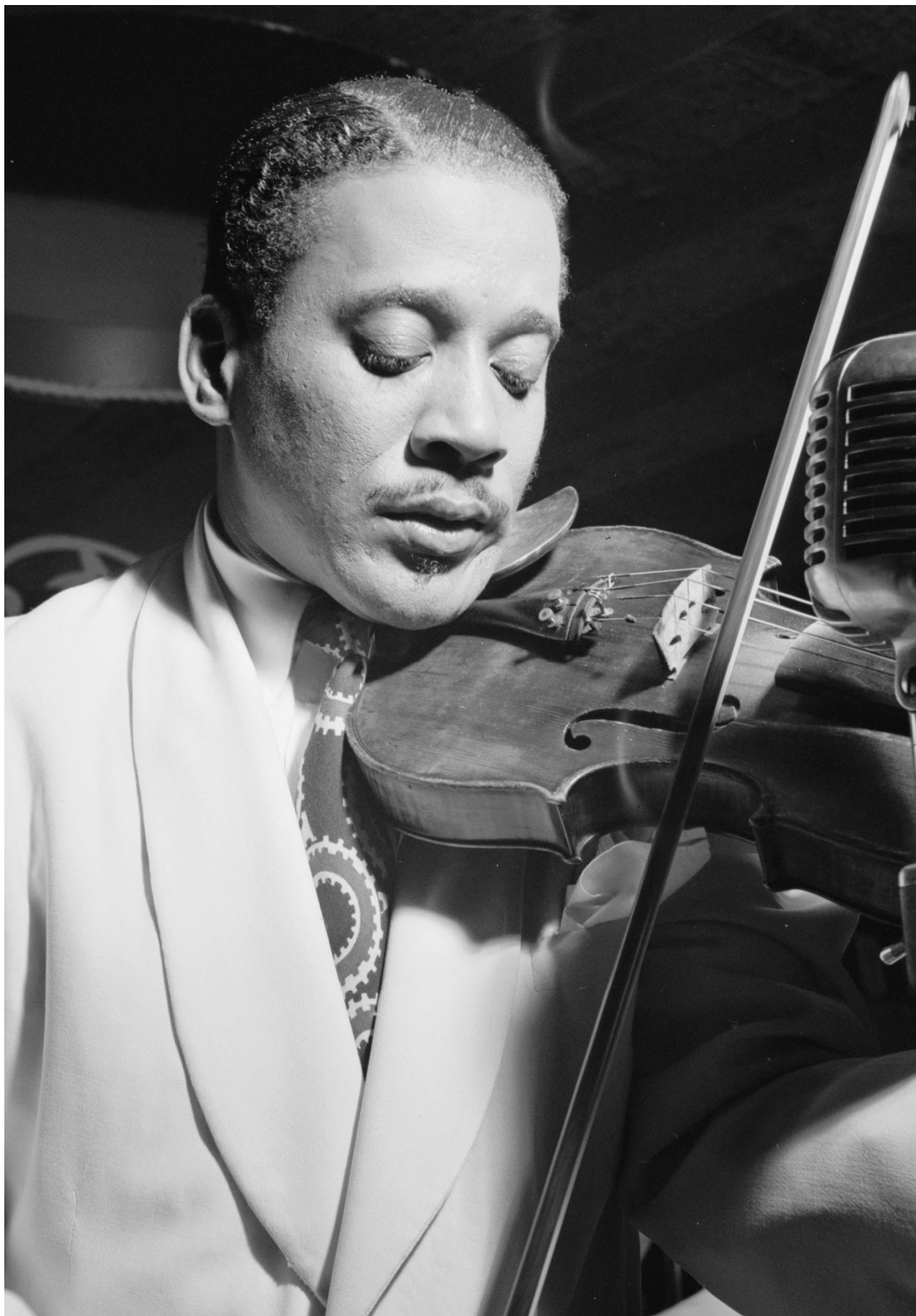
Ray Nance, Aquarium, New York, november 1946.