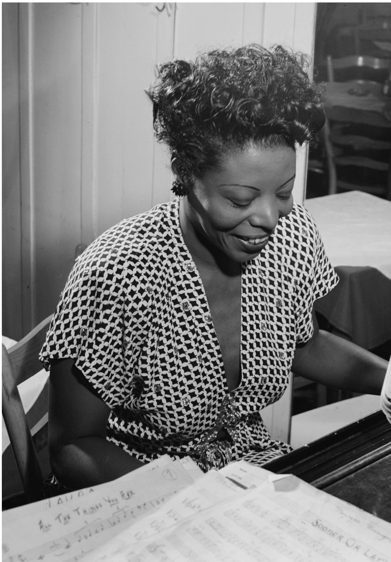
Mary Lou Williams, New York, ca. 1946.