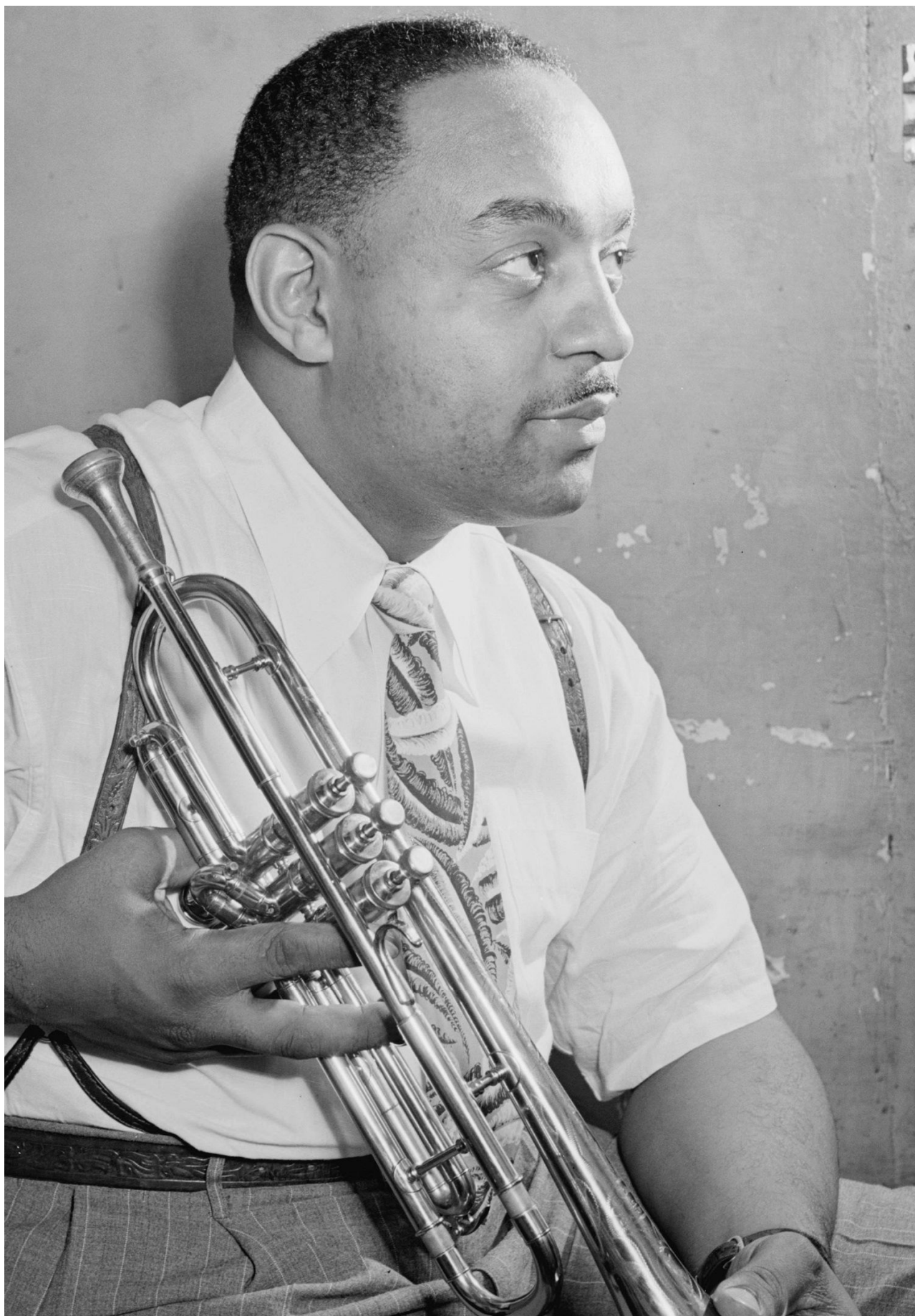
Benny Carter, Apollo Theatre, New York, oktober 1946.