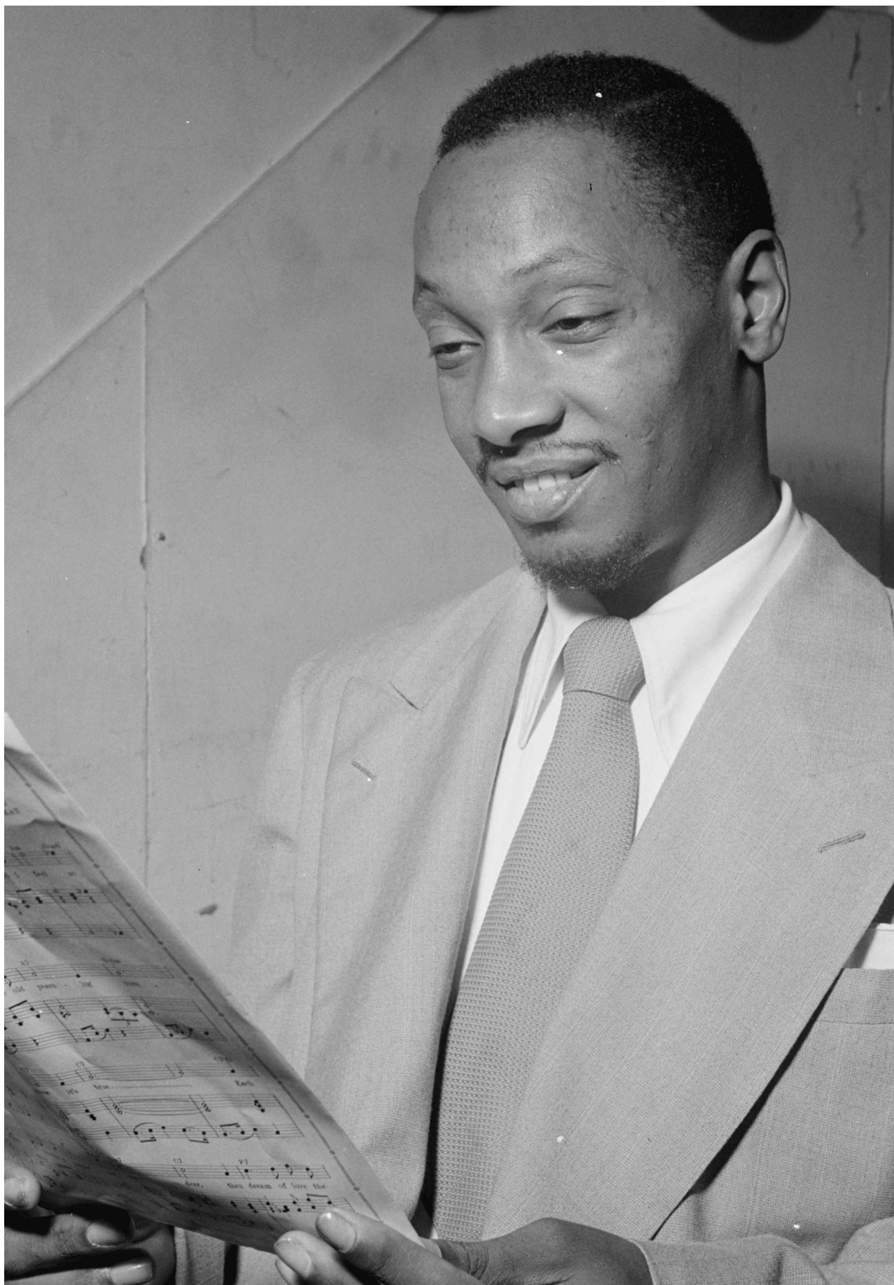
Tadd Dameron, september 1947.