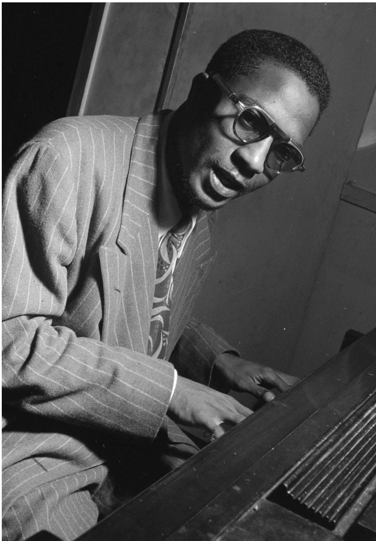
Thelonious Monk, Minton's Playhouse, New York, september 1947.