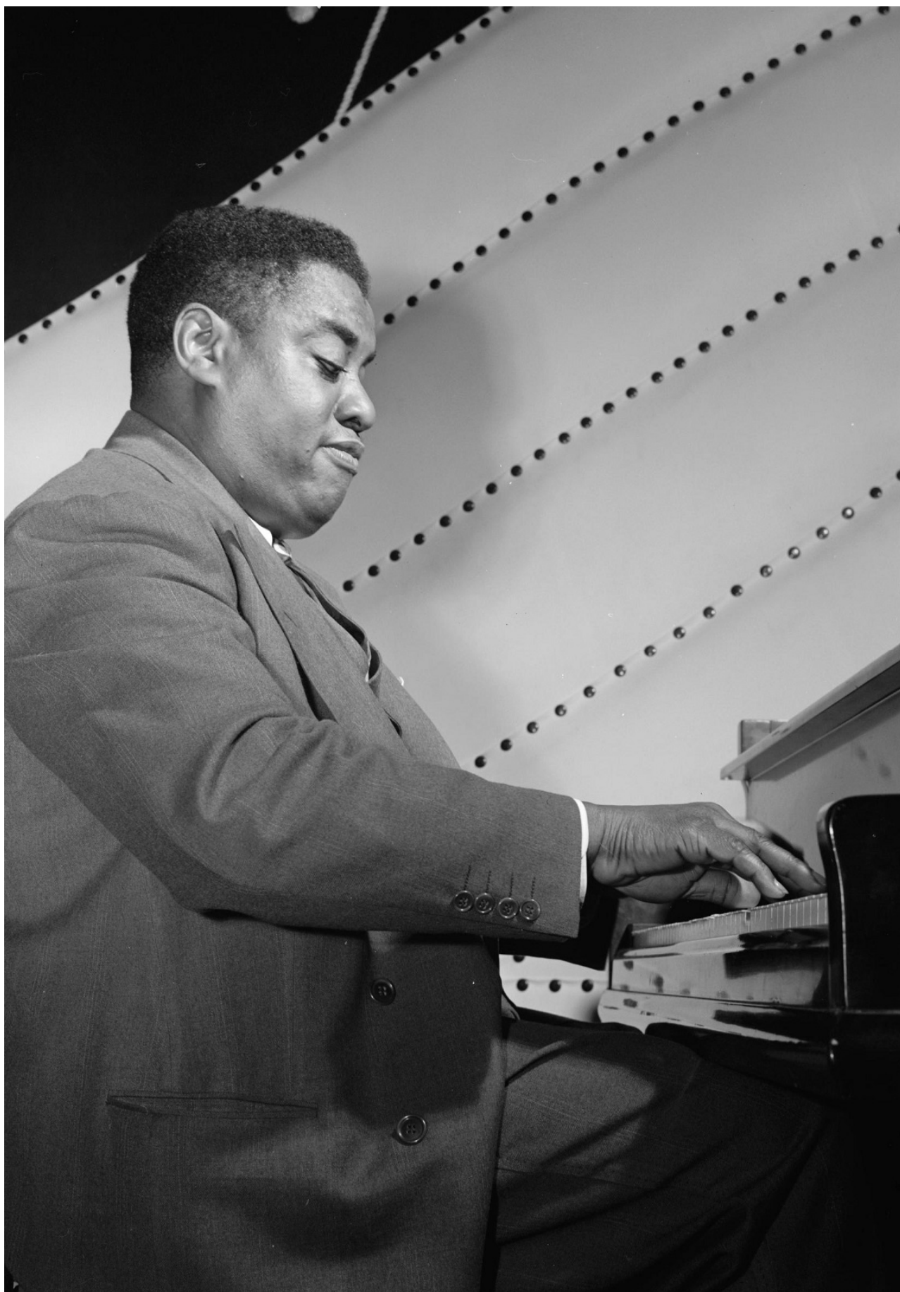
Art Tatum, Vogue Room, New York, tussen 1946 en 1948.