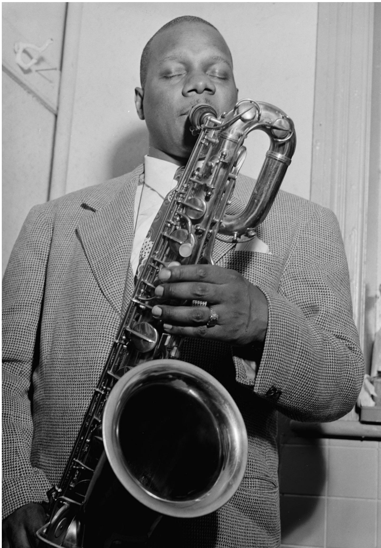
Harry Carney, Turkse ambassade, Washington, D.C., 193?.