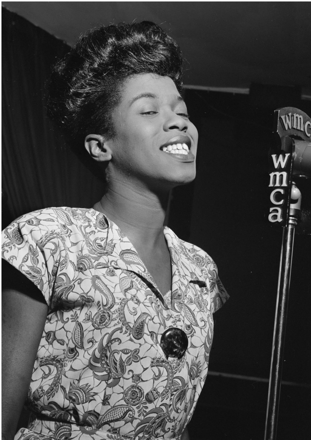
Sarah Vaughan, Café Society (Downtown), New York, september 1946.