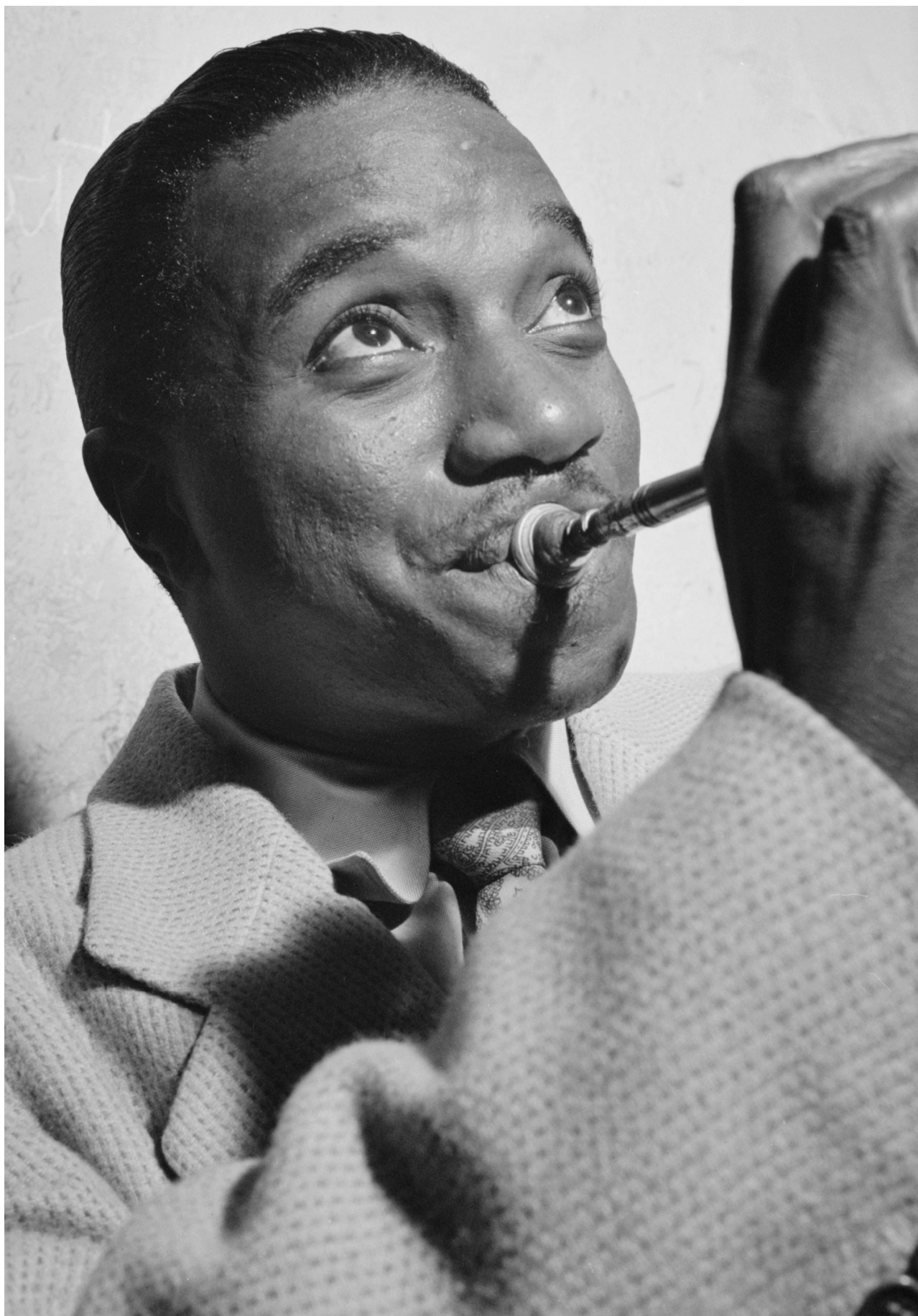
Hot Lips Page, Apollo Theatre, New York, oktober 1946.