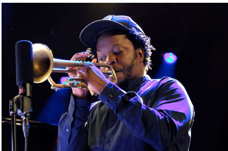
Ambrose Akinmusire.

AMBROSE AKINMUSIRE EN LAKECIA BENJAMIN GENOMINEERD VOOR GRAMMY AWARD 2025