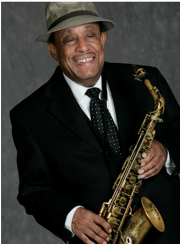
Lou Donaldson.