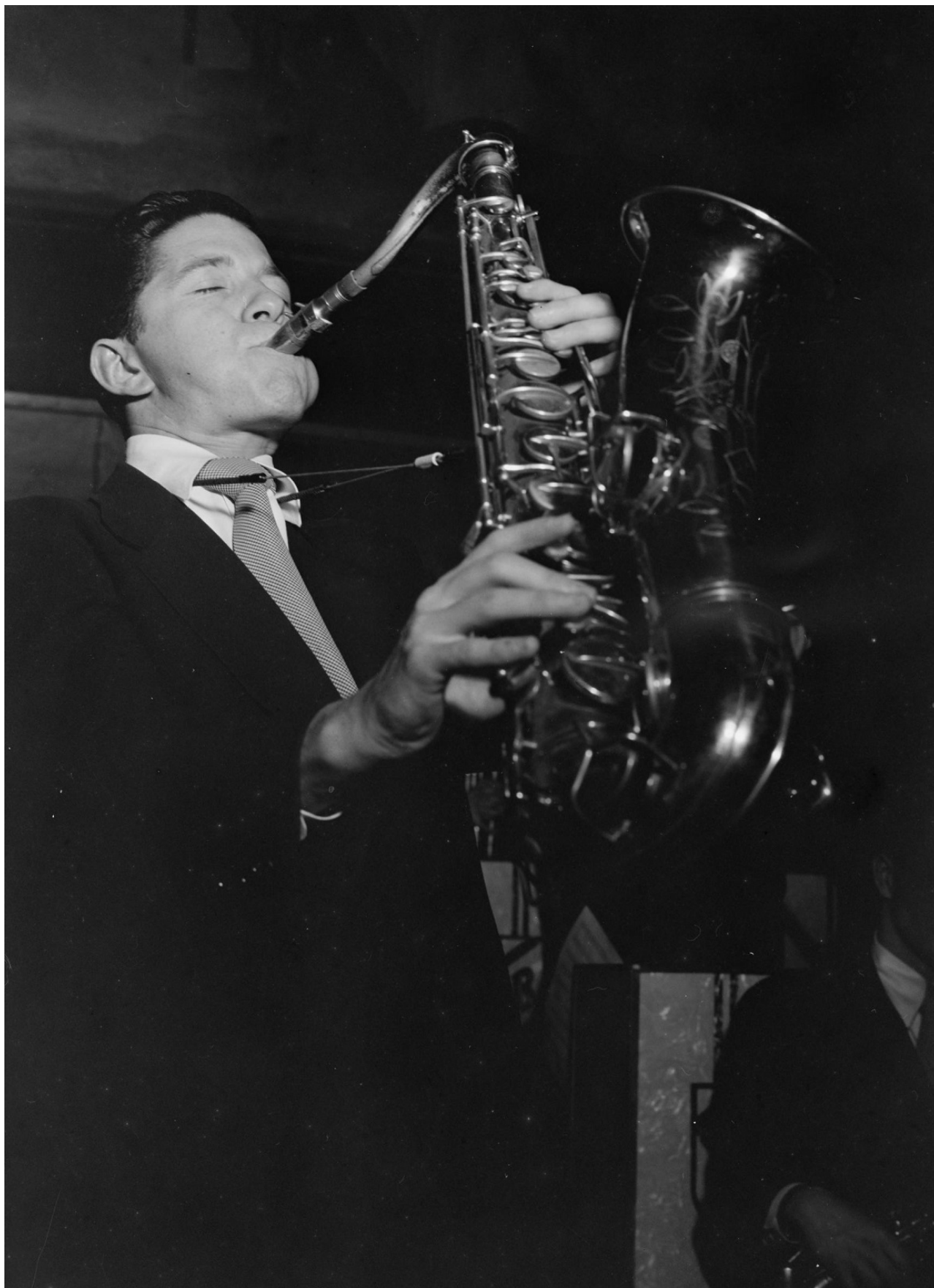
Allen Eager, Arcadia Ballroom, New York, mei 1947.