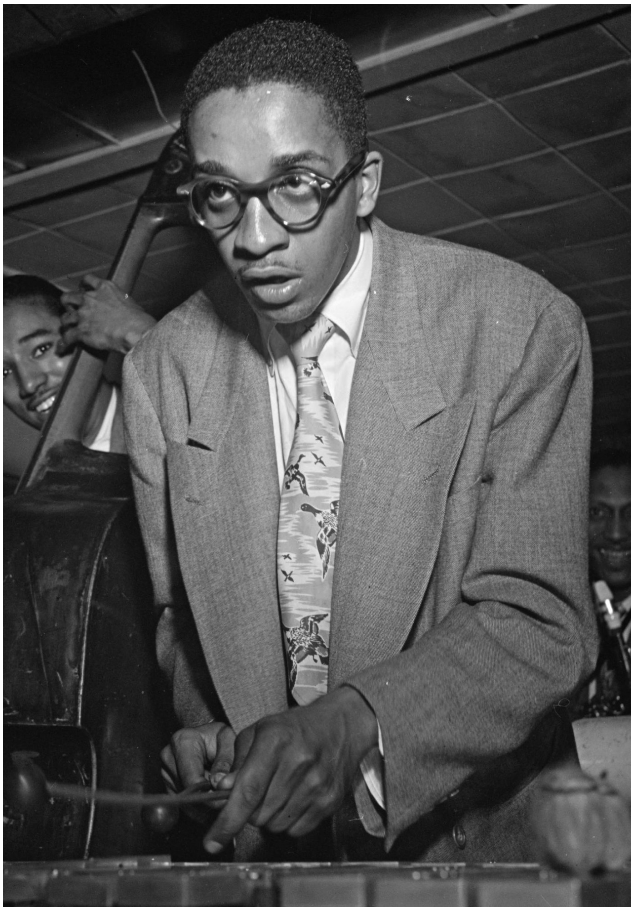
Milt Jackson, New York, tussen 1946 en 1948.