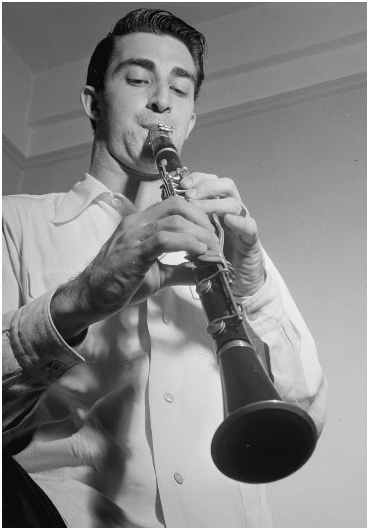
Buddy De Franco, New York, september 1947.