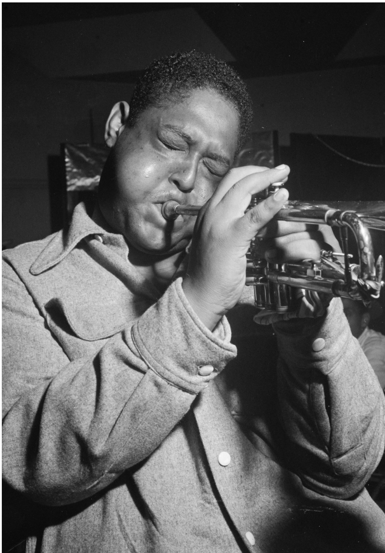
Fats Navarro, New York, tussen 1946 en 1948.